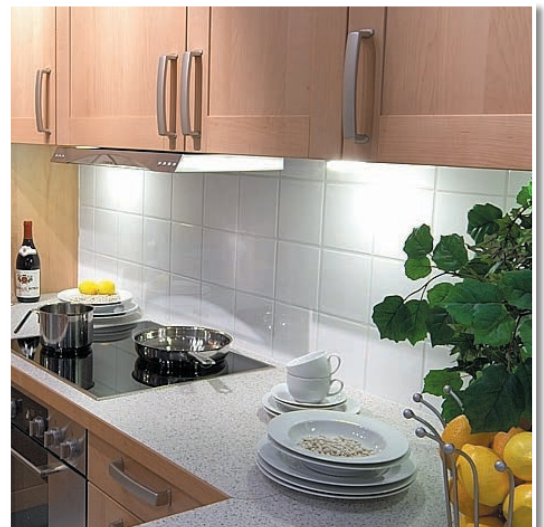
Fliesenkleben sauber und perfekt in einer Küchezeile.