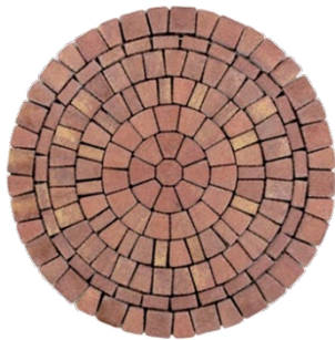
Ø 168 x 6 cm