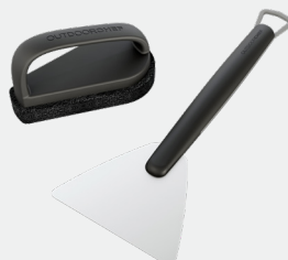
PLANCHA CLEANING SET