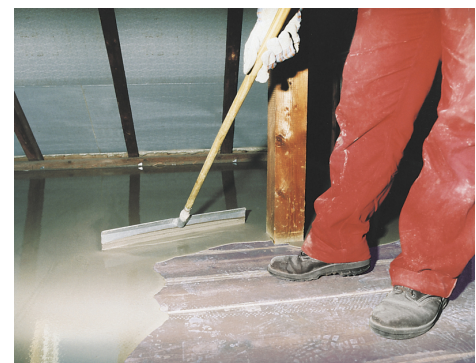
Faserarmiertes PCI Periplan Extra eignet sich hervorragend für Renovierungs- und Modernisierungsarbeiten beim Ausgleich von Holzdielen- und Spanplattenböden.