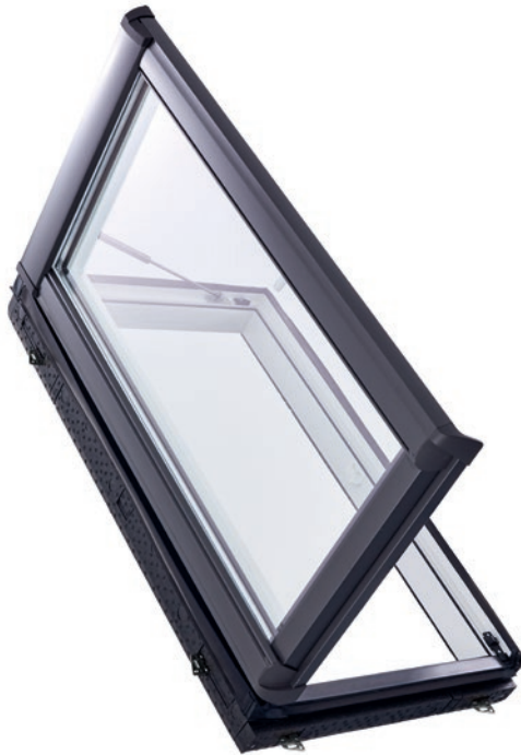
Bild zeigt Flügelanschlag rechts von innen gesehen.

Dachfenster mit Standardmaß in Kunststoff für beheizte Dachräume