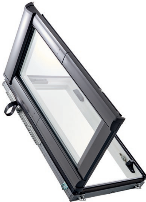
Bild zeigt Flügelanschlag rechts von innen gesehen.