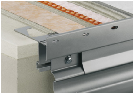
Aufbau mit Schlüter®-DITRA-DRAIN 4 und Schlüter®-BARA-RTKE