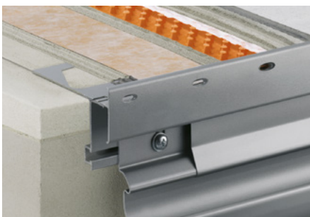
Aufbau mit Schlüter®-DITRA-DRAIN 8 und Schlüter®-BARA-RTKE