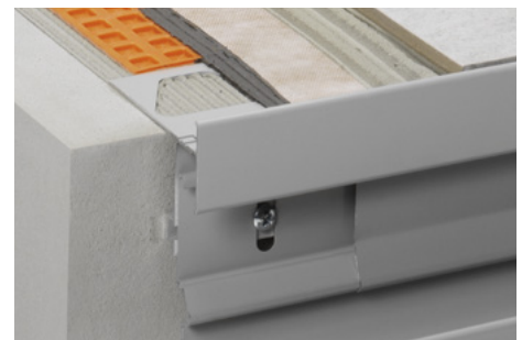
Aufbau mit Schlüter®-DITRA 25 und Schlüter®-BARA-RTKEG

Profilhöhe: _____ mm Farbe: _____ Art.-Nr.: _____ Material: _____ €/m Lohn: _____ €/m Gesamtpreis: _____ €/m