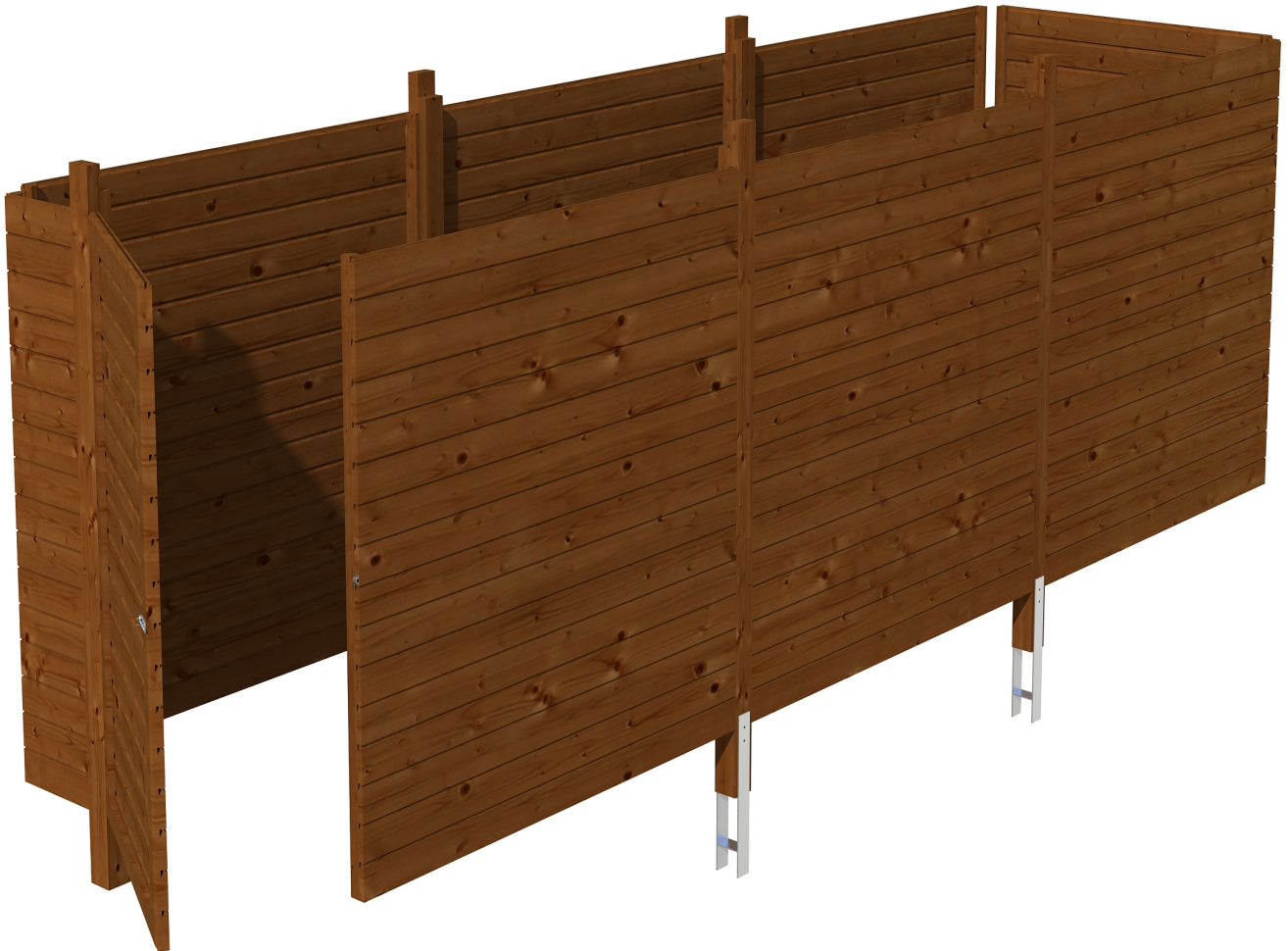
Produktbild Abstellraum C5