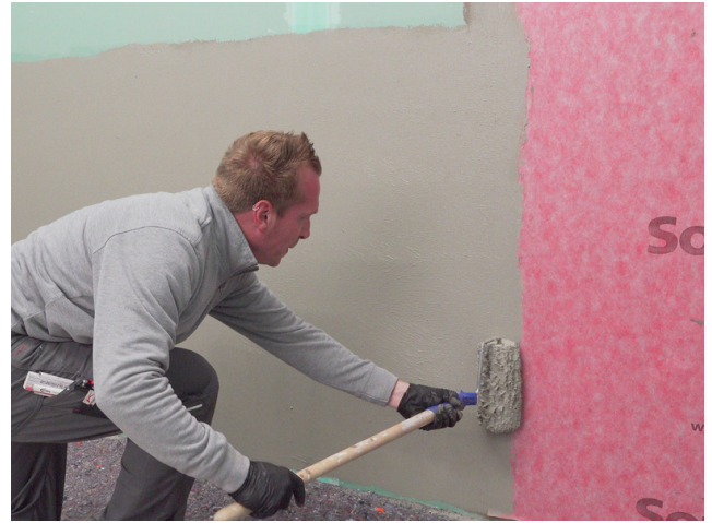
Die Überlappungen der Sopro Abdichtungs- und EntkopplungsBahn ca. 5 cm mit Sopro Fixier- & DichtKleber oder Sopro DichtSchlämme Flex RS überarbeiten.