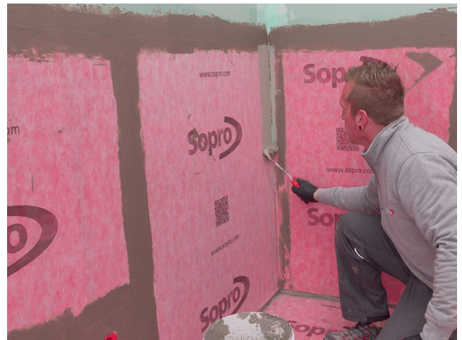
Stoßbereiche der Sopro AEB® Abdichtungs- und EntkopplungsBahn werden mit Sopro AEB® Dichtband Flex (mit Falz) überarbeitet.