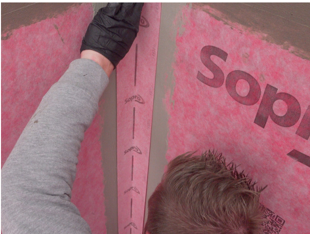
Das passgenau zugeschnittene Sopro AEB® Dichtband Flex (mit Falz) ohne Schlaufenbildung in die frische Klebeschicht einlegen und fest andrücken.