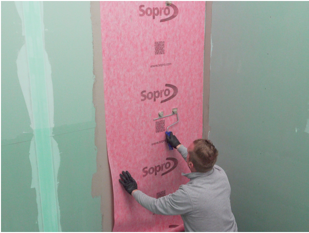
Die passgenau zugeschnittene Sopro AEB® Abdichtungs- und EntkopplungsBahn in die frische Klebeschicht einlegen und von der Mitte her fest andrücken.