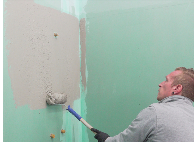
Sopro Fixier- & DichtKleber oder Sopro DichtSchlämme Flex RS vollflächig aufrollen.