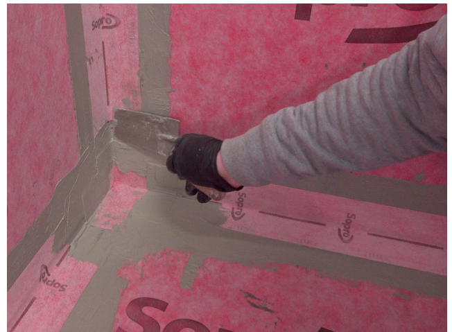
Abschlüsse des AEB® Dichtband Flex (mit Falz) werden im Anschluss mit Sopro Fixier- & DichtKleber oder Sopro DichtSchlämme Flex RS überarbeitet.