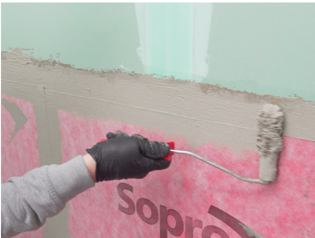
Die Abschlüsse der Sopro AEB® Abdichtungs- und EntkopplungsBahn mit Sopro Fixier- & DichtKleber oder Sopro DichtSchlämme Flex RS überarbeiten.