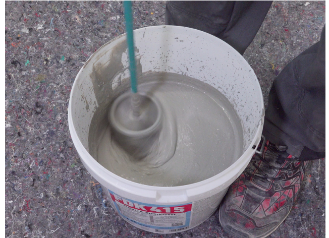
FDK 415: Flüssigkomponente vorgeben und mit Pulverkomponente maschinell anmischen. Alternativ: DSF RS im vorgegebenen Verhältnis mit Wasser anrühren.