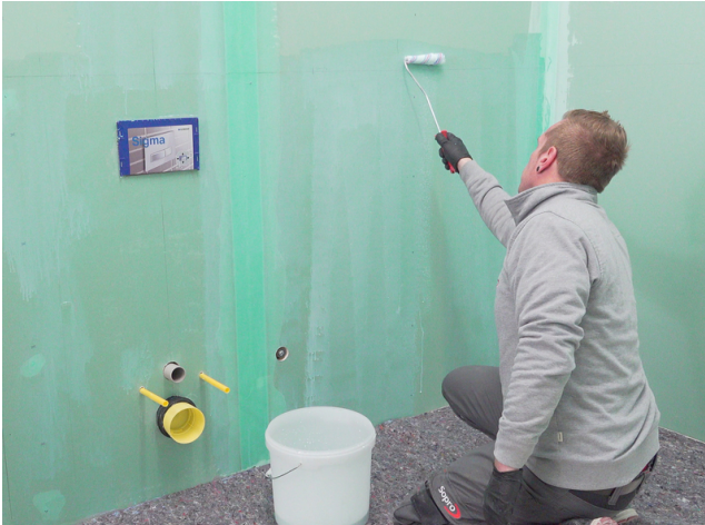
Saugende Untergründe mit Sopro Grundierung vorbehandeln.