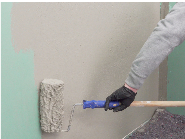
Für ein gleichmäßig deckendes Ergebnis Sopro Fixier- & DichtKleber oder Sopro DichtSchlämme Flex RS im Kreuzgang auftragen.