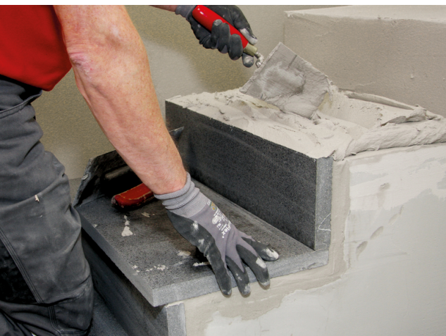
Sopro FKM® Silver kann auch in höheren Schichtstärken bis 20 mm verarbeitet werden.