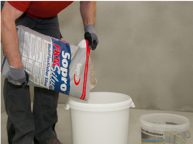
Anrühren von Sopro FKM® Silver in der gewünschten Konsistenz für die Verlegung im Dünn-, Fließ- oder Mittelbett bzw. zum Spachteln.