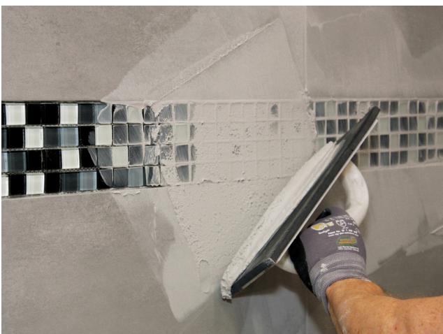
Verfugen mit Sopro DF 10® DesignFuge Flex im Farbton silbergrau.