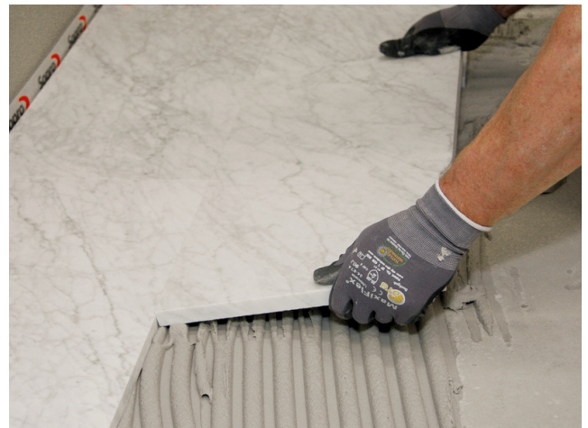
Einlegen einer Natursteinplatte. Aufgrund der hellen Farbe eignet sich Sopro FKM® Silver auch für die Verlegung durchscheinender Materialien.