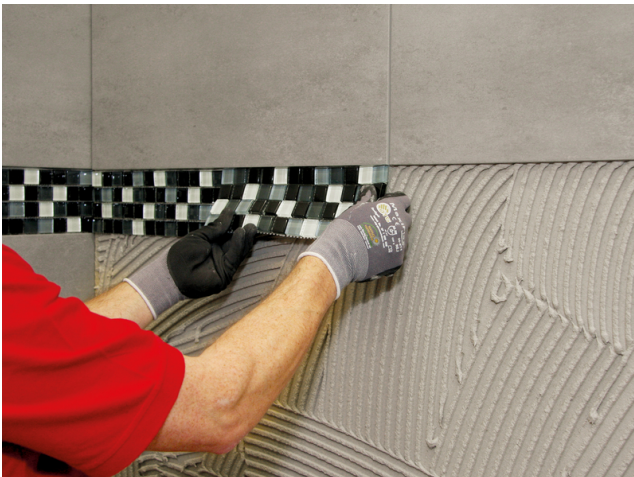
Einlegen von Glasmosaik in das vorbereitete Kleberbett.