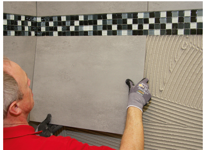
Sehr gute Standfestigkeit zum Ansetzen von großformatigem Feinsteinzeug.