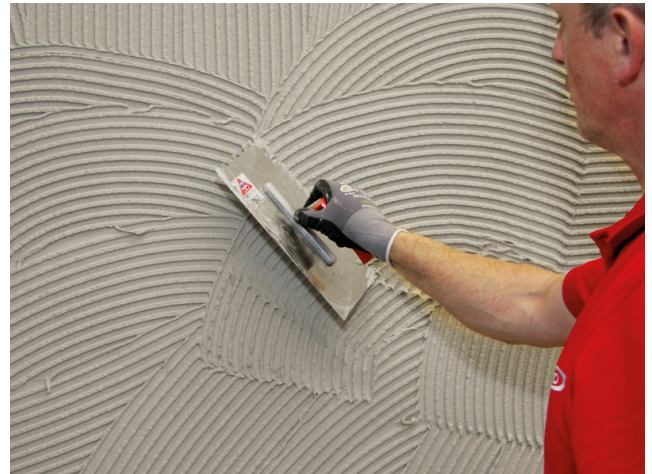
Aufziehen der Kontaktschicht und des Kammbetts in der Dünnbettkonsistenz.