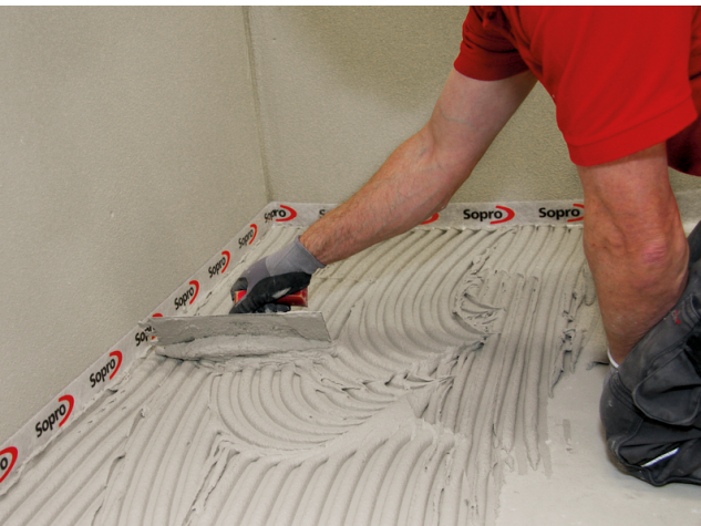
Zur Mittelbettverlegung Sopro FKM® Silver in der Mittelbettkonsistenz aufziehen.