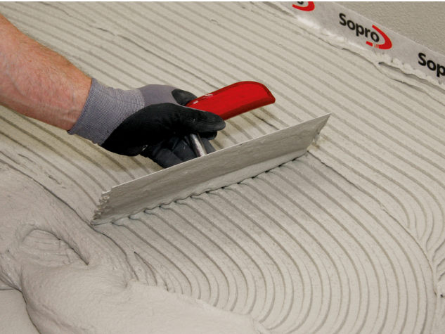
Aufziehen der Kontaktschicht und des Kammbetts in der Fließbettkonsistenz.