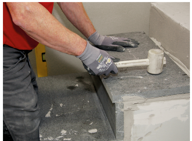
Verlegen einer Treppenstufe. Aufgrund der Schnellerhärtung kann eine frühe Belastung erfolgen.