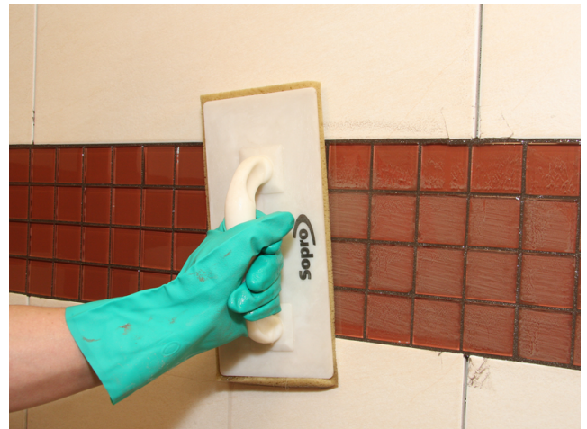
Abwaschen des Glasmosaiks nach ausreichender Standzeit des Fugemörtels.