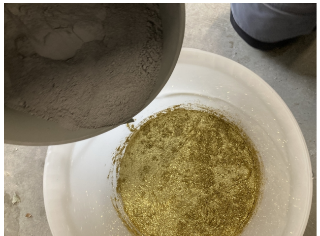
Der Fugenmörtel wird dem mit Glitter versetzten Anmachwasser zugegeben.