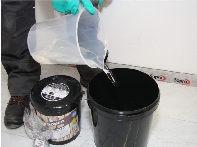
In einen sauberen Eimer sauberes Wasser gemäß Tabelle vorgeben.