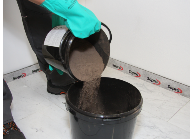
Sopro DF 10 zudosieren und maschinell anrühren.