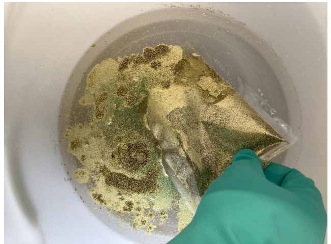
Die Entleerung des Glitters erfolgt im Wasser.