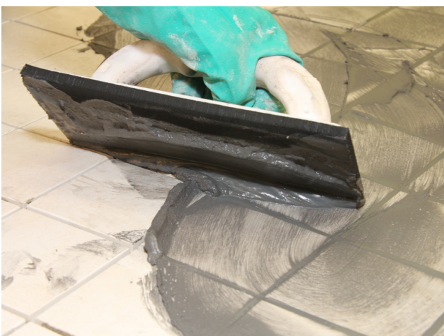
Einfugen von Sopro DF 10 in Feinsteinzeugfliesen.