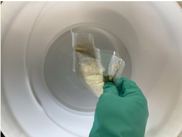
Nach vorsichtigem Aufschneiden des Beutels wird der Glitter in das Anmachwasser gegeben.