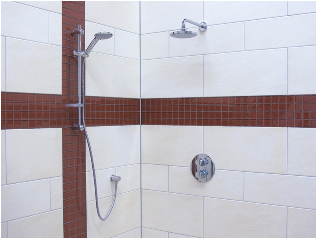
Farbbrillante Fugenfläche im Badezimmer.