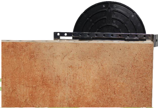
Abbildung 6: Anwendungsbeispiel Randverlegung: Hier Volfiplatte VP-UI 4/10 mit Wandabstandhalter WAE-K14