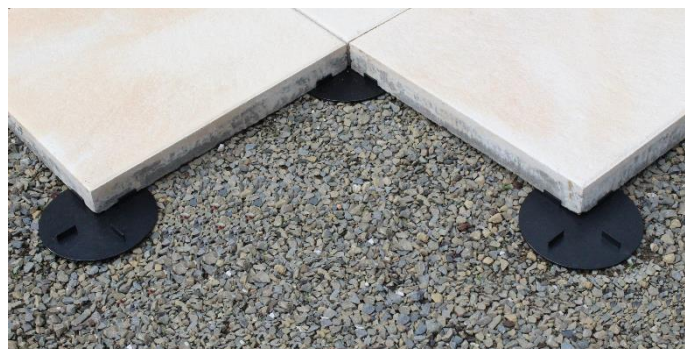
Abbildung 2 und 3: Verwenden Sie die VS-U auf festem, ebenem Untergrund oder im Kiesbett