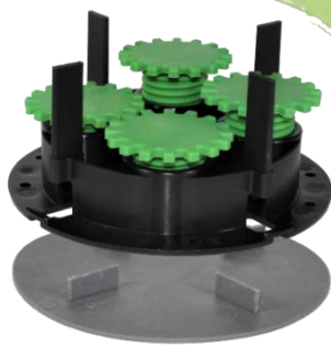
Abbildung 4: Die Volfischeibe kann im gesamten Volfiteller-System als kleine Erhöhung und in gummierter Ausführung als dünne Entkoppelung zum Trittschalldämmung zum Untergrund verwendet werden.