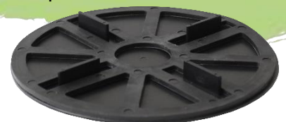
Abbildung 5: Volfischeibe VS-U mit Ausgleichring VT-A

Die rutschhemmende Ausgleichscheibe VT-A wird zur Erhöhung und Trittschalldämmung ein- oder mehrfach in die Fugenstege der Volfischeibe VS-U oder unter die Volfischeibe gelegt. Dabei ist darauf zu achten, dass der Fugensteg der VS-U mindestens 5 mm herausragt.