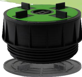
Abbildung 2: Volfiplatte gummiert VP-GKU 4/10 mit Teleskop Dreh-Stelzlager TL-V45.

Für größere Aufbauhöhen ist die VP-GKU kombinierbar mit den Volfitellern VT-B und VT-U (mehrfach stapelbar) sowie allen Schraub-Stelzlager ZR-V und Teleskop Dreh-Stelzlager TL-V .