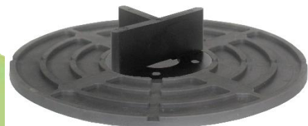
Abbildung 6: VP-GKU 0/00 mit mittig eingelegtem FK-BT.

Für vollständige Flexibilität nutzen Sie die VP-GKU 0/00.