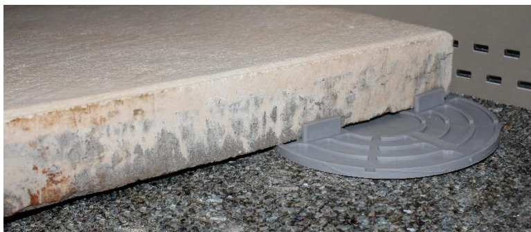
Abbildung 7: Anwendungsbeispiel Volfiplatte verlegt auf Bitumenschweißbahn

Diese Kombination eignet sich ideal um einen bestehenden Plattenbelag mit minimaler Aufbauhöhe zu modernisieren.