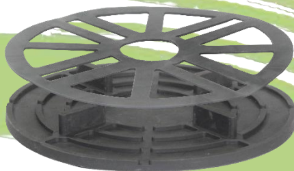
Abbildung 5: Volfiplatte mit aufgelegter Ausgleichscheibe VT-A 1mm. Zur Feinabstimmung