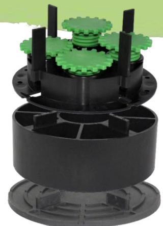
Abbildung 4: Volfiplatte gummiert VP-GKU 4/10 mit Volfiteller VT-U 50 und Schraub-Stelzlager ZRV.

Die 4 mm Fugenstege versenken sich passgenau im VOLFI-Schraub-Stelzlager ZRV , VOLFI Teleskop Dreh-Stelzlager TL-V oder Volfiteller VT-B/VT-U als formschlüssige Verbindung.