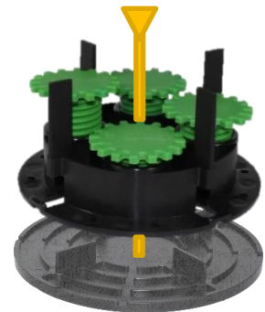
Abbildung 3: Alle Volfiplatten Ausführungen lassen sich als unterstes Element im Volfiteller System (wie hier) zur 5mm Erhöhung, bzw. als Entkopplung einsetzen.